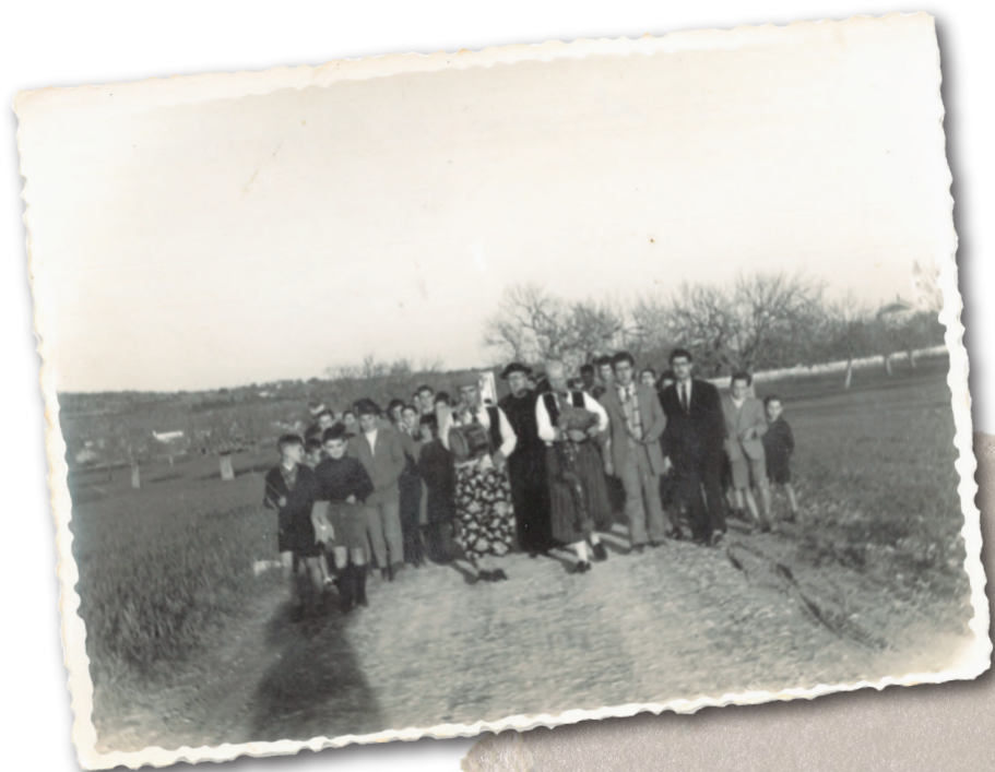
Grup de xeremiers a l'entrada de Son Carrió, devers anys 40