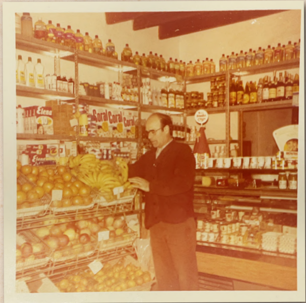
Botiga de Ca na Mac