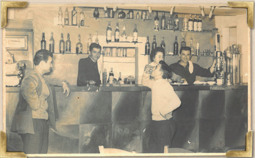
Cafè Cas Mosso