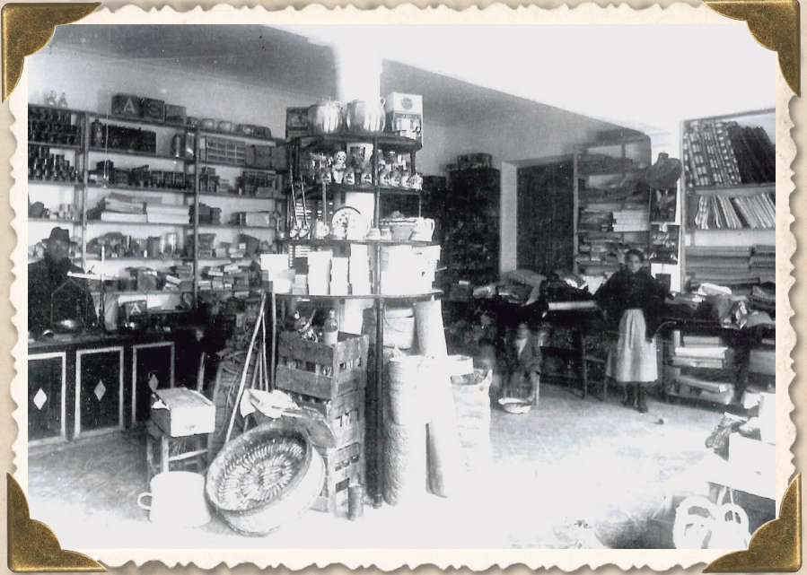
Botiga de Can Pi