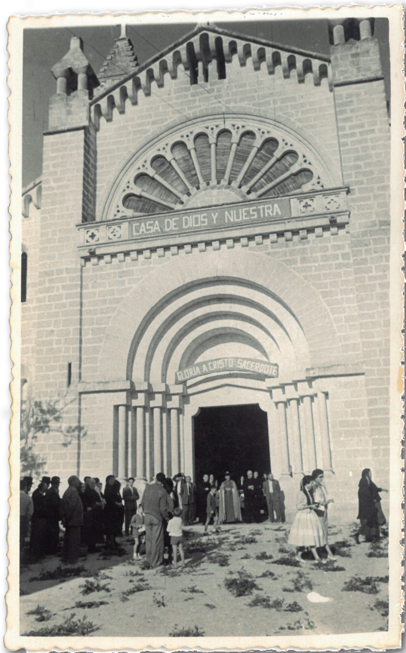
Homenatge a Mn. Montserrat Servera Nebot 21 de setembre de 1958