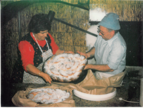
Ensaimades de cas Mosso